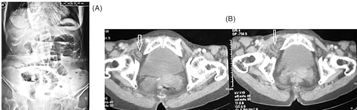
Hình 2: (A) Phim XQ bụng không chuẩn bị: hình ảnh mức nước - hơi ruột non. (B) Phim CT bụng: hình ảnh cấu trúc hình ống nghi ngờ ruột ở lỗ bịt phải (mũi tên vàng)

Diễn biến sau mổ thuận lợi, bệnh nhân trung tiện ngày thứ 2 sau mổ, và ra viện ngày thứ 12 sau mổ trong tình trạng ổn định.